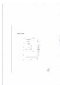
planimetria box auto